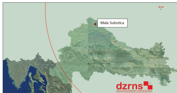
Slika 2. Zona ICPD NE Pakš