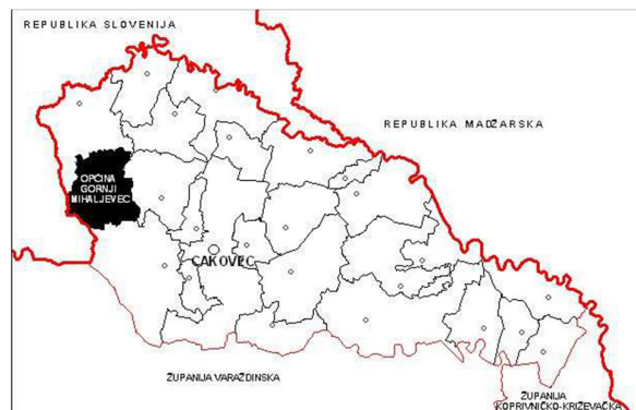
Slika 2. Položaj općine Gornji Mihaljevec unutar Međimurske županije

Taj je prostor, u gospodarskom smislu, desetljećima uvelike bio orijentiran na susjednu Sloveniju – od prometa robe, zaposlenja do obrazovanja i zadovoljenja ostalih potreba građana. Prema ocjeni krajobraznih vrijednosti prostora Županije, područje Gornjeg Međimurja ima karakter osobito vrijednog predjela, kojem u cijelosti pripada i područje općine Gornji Mihaljevec.