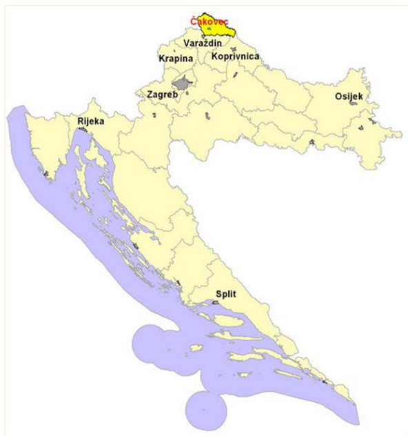
Slika 1. Geoprometni položaj Međimurske županije

Međimurska županija smjestila se na krajnjem sjeveru Republike Hrvatske, između Drave i Mure. Najgušće je naseljena, ali i površinom od 730 km 2 najmanja županija u Republici Hrvatskoj. Prema Popisu stanovništva iz 2011. godine, županija ima 113.804 stanovnika. Graniči s Varaždinskom i Koprivničko-križevačkom županijom te s dvije članice Europske unije, Slovenijom i Mađarskom. Ovakav prometni položaj s jedne strane predstavlja prednost (blizina europskog tržišta), a s druge strane i nedostatak, s obzirom na postojanje šengenskog režima na granicama sa susjednim zemljama. Može se dakle konstatirati da područje cijele županije pa tako i Općine Gornji Mihaljevec posjeduje povoljan tranzitni geoprometni i geopolitički položaj, a da je s druge strane to tipično pogranično područje koje karakterizira postojanje državne granice kao fizičke prepreke u ukupnom prirodnom radijusu kretanja (Sl. 1.). Čakovec je administrativno, gospodarsko, prometno i kulturno središte Međimurske županije. Prema NUTS kategoriji, Međimurska županija pripada Kontinentalnoj Hrvatskoj. Čini je 3 grada (Čakovec, Prelog i Mursko Središće), 22 općine i 131 naselje.