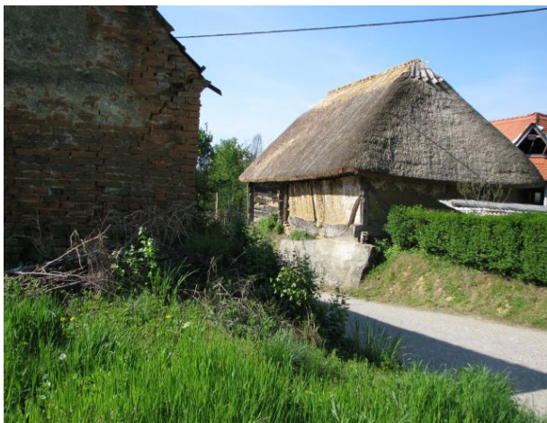
Slika 3. Tradicijska arhitektura Općine Gornji Mihaljevec

Na području Općine Gornji Mihaljevec nema nijedne zaštićene prirodne vrijednosti sukladno Zakonu o zaštiti prirode. Najveći stupanj prirodosti na području obuhvata Općine imaju šume, odnosno autohtone šumske zajednice (hrast kitnjak, grab, bukva).