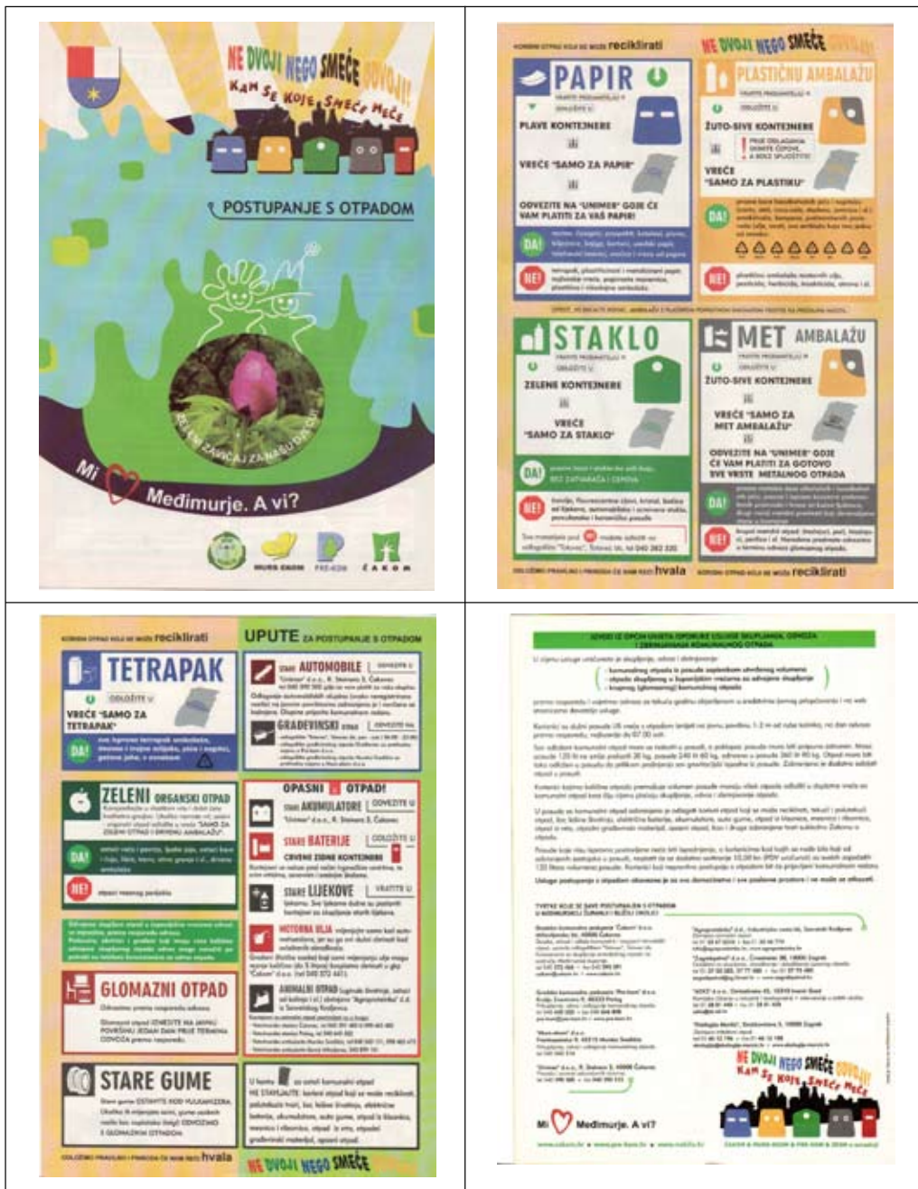
Slika 16 - Županijski edukativni letak

Informiranjem naših korisnika putem medija, letaka i web stranica PRE-KOM-a, nastojimo korisnike dodatno potaknuti na uključivanje u organizirano sakupljanje otpada, a time i odvojeno sakupljanje korisnog otpada.