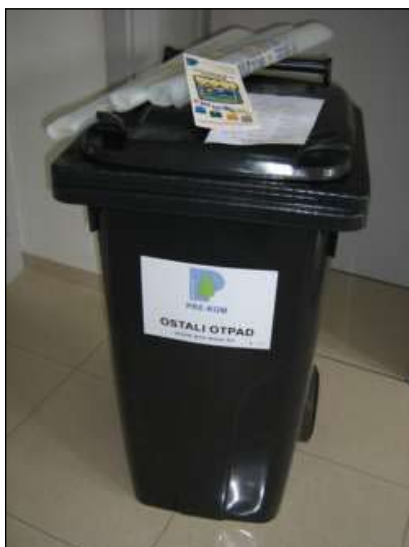
Slika 2 - Kanta za otpad 120 l, vreće za selektivno sakupljanje, edukativni letak

Postupanje sa komunalnim otpadom u Općini Donja Dubrava organizirano je putem GKP PRE-KOM d.o.o..