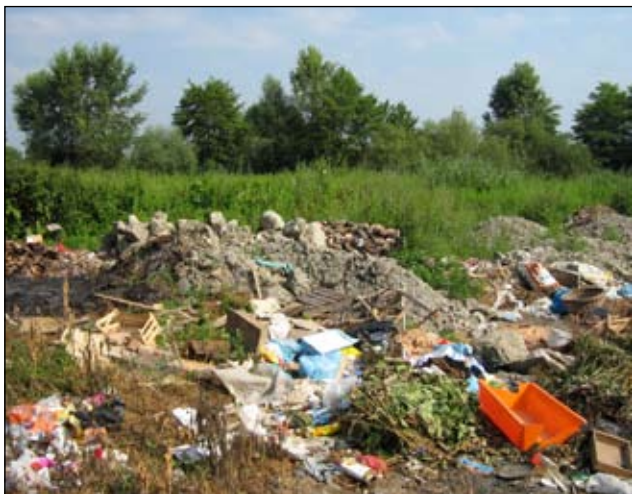
Slika 10 - Hemuševac - prije

Smetlište zatvoreno - dovezena zemlja i planirano