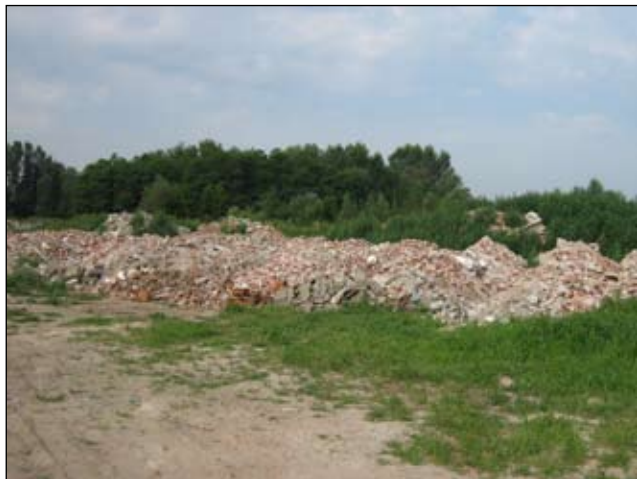
Slika 12 - Draškovec - prije

Bivša šljunčara, otpad se odlaže od 1970. godine. Smetlište je koristilo 676 žitelja Draškovca i 425 žitelja Oporovca.