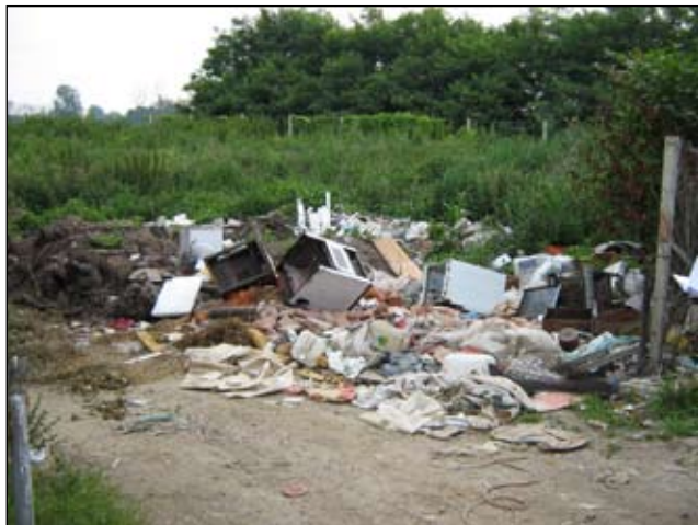
Slika 14 - Cirkovljan - prije