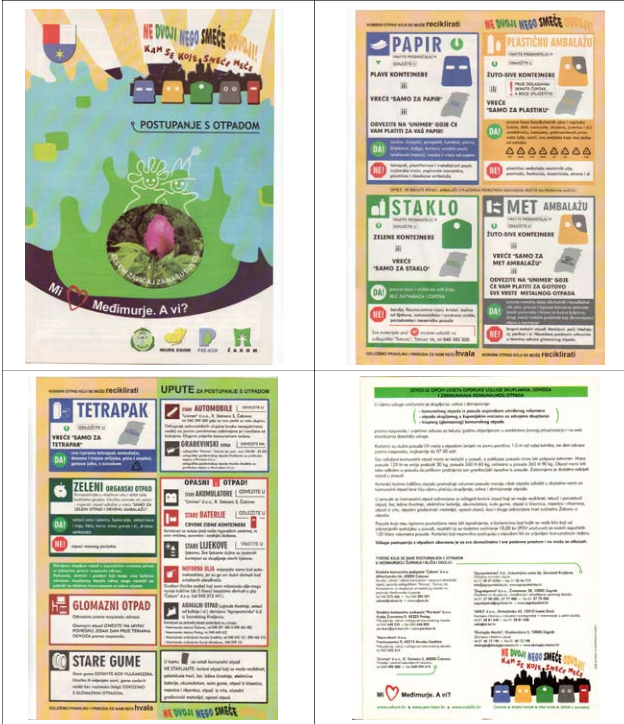
Slika 16 - Županijski edukativni letak

Informiranjem naših korisnika putem medija, letaka i web stranica PRE-KOM-a, nastojimo korisnike dodatno potaknuti na uključenje u organizirano sakupljanje otpada a time i odvojeno sakupljanje korisnog otpada.