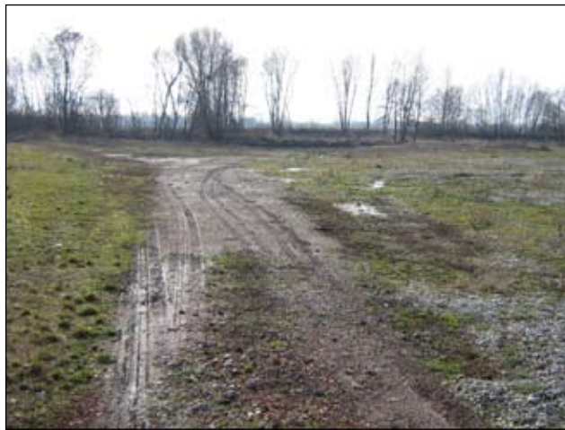
Slika 13 - Draškovec - sada

U 2008. godini potrebno je izvršiti kompletnu sanaciju i to sadnjom autohtonog bilja, te zasijavanjem trave.