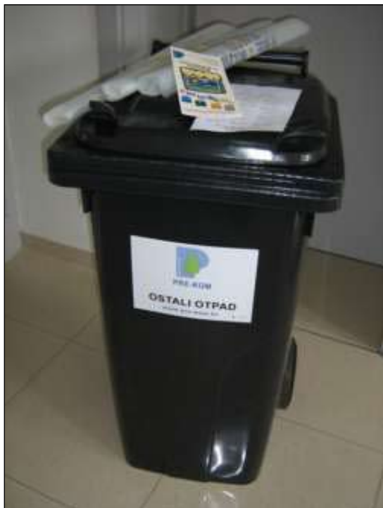
Slika 2 - Kanta za otpad 120 l, vreće za selektivno sakupljanje, edukativni letak