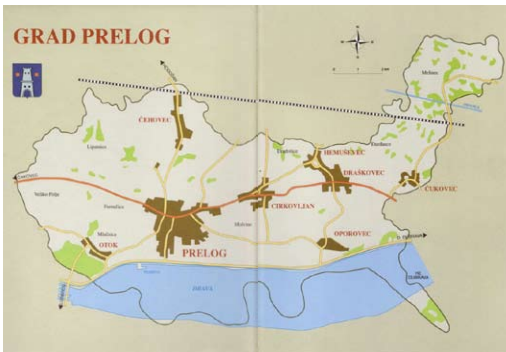
Slika 1 - Plan Grada Preloga

Prelog, grad uz rijeku Dravu, po veličini je druga jedinica lokalne samouprave u najsjevernijoj hrvatskoj županiji. Na oko 6.370 hektara površine, smješten je u donjem dijelu Međimurske županije, istočno od autoceste Goričan - Zagreb. Uza sam Prelog, Grad pokriva i naselja Otok, Čehovec, Cirkovljan, Draškovec, Hemuševac, Oporovec i Čukovec s ukupno oko 7.870 stanovnika.