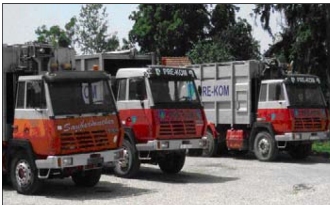
Slika 6 - Kamion za sakupljanje smeća

GKP PRE-KOM d.o.o. odlaže/zbrinjava otpad s područja Grada Preloga na sljedeći način: