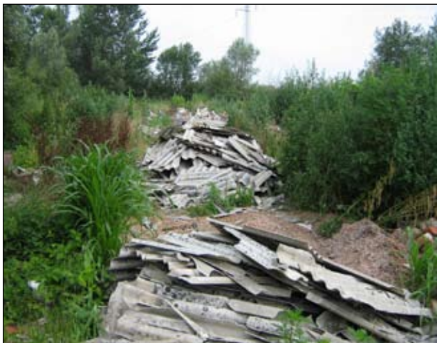
Slika 8 - Čukovec - prije