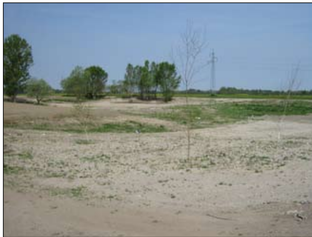
Slika 15 - Cirkovljan - sada